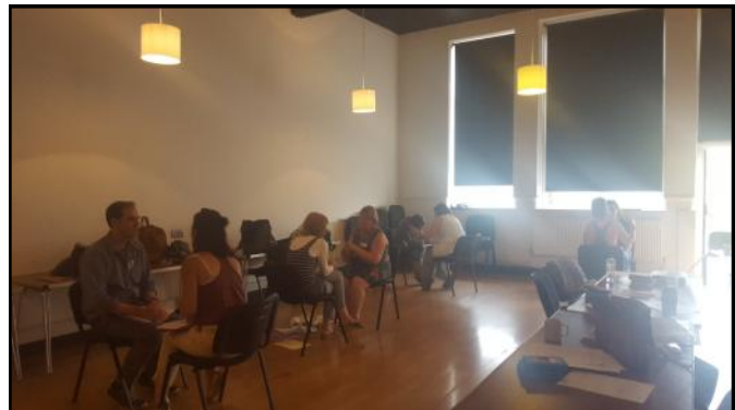
Dêtio Cyflym ar gyfer rhannu a herio syniadau am arddangosfeydd