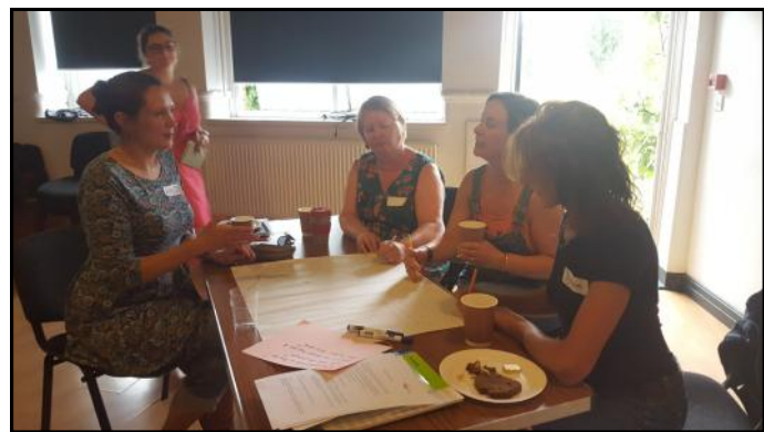
Mae artistiaid yn cael y cyfle i gymysgu y tu allan i'w grwpiau Mentor arferol