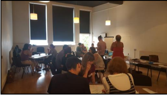
World Cafe ar gyfer trafod pynciau penodol

Ym mis Gorffennaf, daeth y tîm cARTrefu i gyd at ei gilydd am ddiwrnod o hyfforddiant, rhannu syniadau a dal i fyny. Gan fod artistiaid a mentoriaid cARTrefu wedi'u lleoli ledled Cymru, mae'r Fforymau'n gyfle i bawb ddod at ei gilydd a rhannu arfer gorau. Roeddem yn gallu defnyddio technoleg ddigidol i ddal i fyny gyda'n harlunwyr a'n mentoriaid nad oedd yn gallu bod yn bresennol ar y diwrnod.